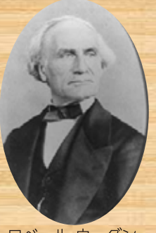
ロバール・ウーダン

大道芸から枝分かれ「近代奇術の父」が起した革命 日本が幕末とよばれる時代、フランスは革命と戦争の影響で失業者があふれていました。当時のマジシャンは、怪しげな見世物として大道芸人に交じって、投げ銭をもらい生きていたそうです。