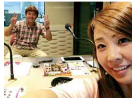
FMとやまHPで公開中、もちろん無料です!

富山、石川、福井、新潟で出演 テーブルマジックでの おもてなし企画が人気 ステーキショーとは違い、少ない人数を相手に演じるテーブルマジック。宝石店、カーディーラーなど大切なお客様のおもてなし企画として人気です！