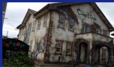
魔法学校を開校しているさの小児歯科医院さんが更に進化！驚きの外観が話題です。