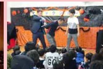
10/15 愛護幼稚園さんで ステージマジックショー2回公演