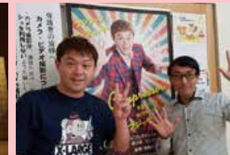
10/21 小学校公演会場にて たくさんの方の大型ポスターに感謝!