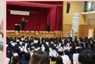
10/21 舟橋小学校さんで 70分のステージマジックショー