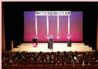
10/14 福岡地区敬老会、Uホールで ステージマジックショー