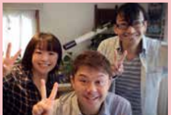
10/13 コンプラジオ収録 イラストレーターおびちゃんのアトリエにて

「これだよって」と尋ねました。一瞬その場が凍りつきましたが、次の瞬間には驚きと大きな笑いが起こりました。星の数がいくつあるのかは分かりませんが、きっと私のマジックも百種類程度の事なのでしようが、お客様に観ていただきたい演目は私の中にまだまだたくさん光り輝いています。