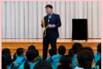
10/20 入善ひばり野小学校 PTA講演会にコンプさんが出演